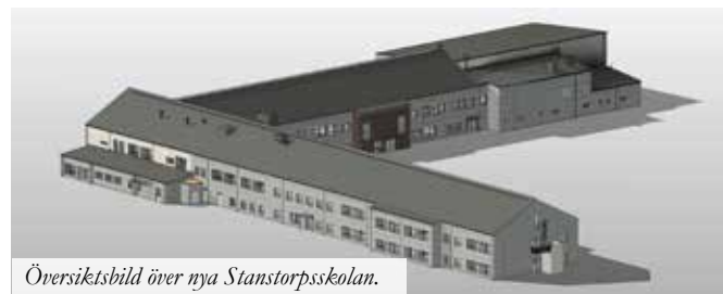
Översiktsskild över nya Stanstorpskolan.

Under hösten börjar man med idrottshallen och den stora utbyggnaden i nordväst. Dessa etapper beräknas ta drygt ett år att färdigställa.