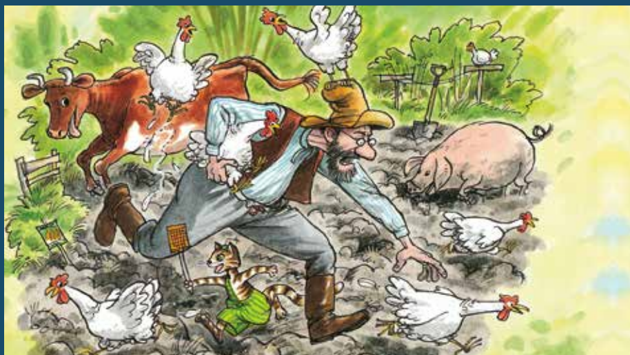
Pettson och Findus fyller 40 år.

Biblioteket firar att det är 40 år sedan den första boken av Sven Nordqvist om Pettson och Findus gavs ut. Vi firar med tipsrunda och